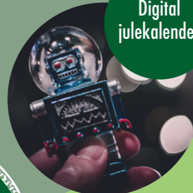
FARBSYNTHESE FRA PIXABAY